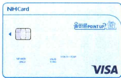
※연회비 : W(JCB) 1만2천원, VISA-MASTER 1만4천원